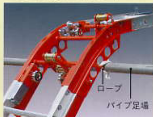
ロープ パイプ足場

延長用舟を取り付ければ曲がりレールのセット範囲が広がり、ワイヤーがこすれる心配もありません。