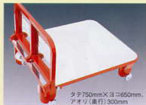
タテ750mm×ヨコ650mm、 アオリ(奥行)300mm

錆びにくいステンレス張りの美しい台車で、コーナー部分は一体成型、曲面加工し、強度をアップ。グーンと使い易くなりました。